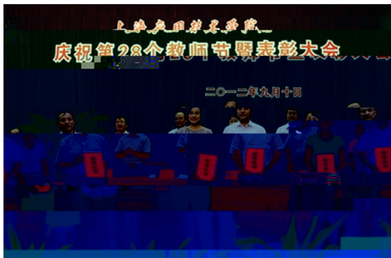
校长奖获得者风采